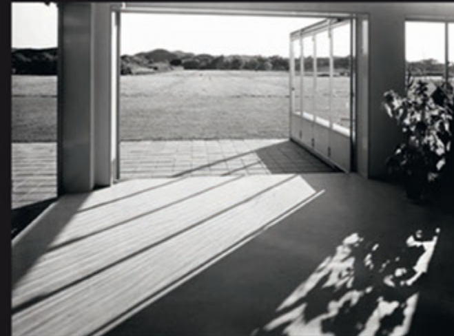
Sommerhaus Groet, Noord-Holland 1934