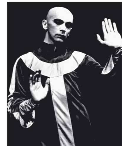
Lotte Jacobi Harald Kreutzberg in dem Tanz »Choral«, Berlin 1934 Reproduktion 1996