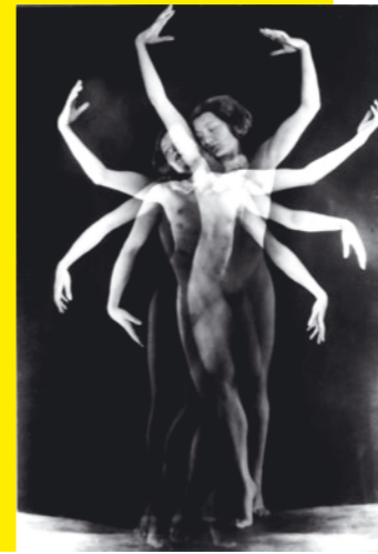
Yva Der Seestern (Die Tänzerin Claire Bauhoff), um 1930, Reproduktion 2000

It was film-makers, but in particular photographers, who ensured that these avant-garde performances reached a wider audience: an impressive